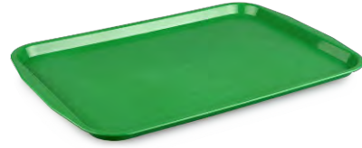
» Servis Tepsisi (ABS) Serving Tray (ABS)