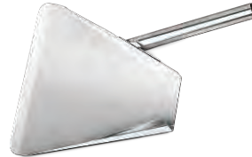
» Patates Küreği French Fries Shovel