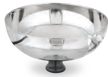
» Pilav Ölçeği Rice Scoop