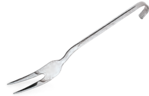
» Servis Çatalı Meat Fork for Serving