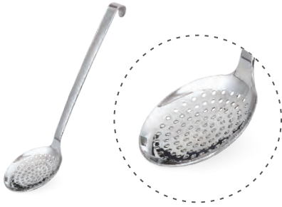
» Kevgir Skimmer