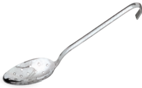
» Süzgeçli Servis Kaşık Perforated Serving Spoon