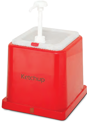
» Ketçap Dispenseri Ketchup Dispenser