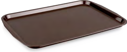
» Servis Tepsisi (ABS) Serving Tray (ABS)