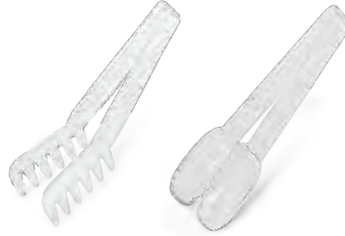
» PC Maşa plast|port PC Tong