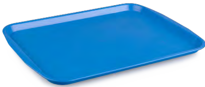
» Servis Tepsisi (ABS) Serving Tray (ABS)