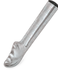
» Dondurma Kaşığı Ice Cream Spoon