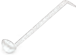
» PC Sos Kepece plast|port PC Sauce Ladle