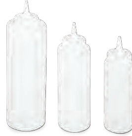
» Mayonez Şişesi Mayonnaise Bottle