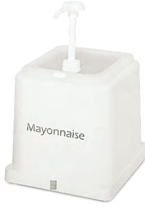
» Mayonez Dispenseri Mayonnaise Dispenser