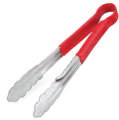
» Silikon Saplı Servis Maşa Serving Tong w/Silicone Handle