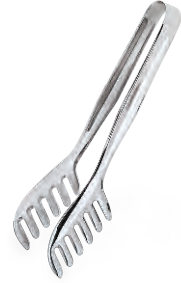
» Spagetti Maşa Pasta Tong