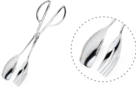
» Makaslı Maşa Salad Tong