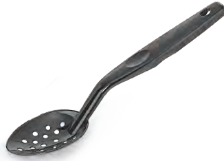
» PC Delikli Servis Kaşığı plast|port PC Perforated Serving Spoon