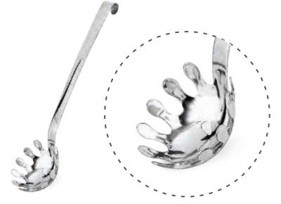
» Spagetti Kasığı Spaghetti Spoon