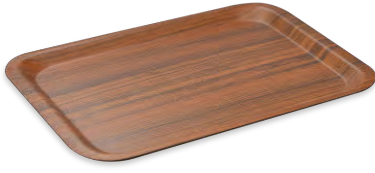
» Ecoform Tepsi Ecoform Rectangular Tray