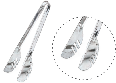
» Çok Amaçlı Maşa Multi-Purpose Tong