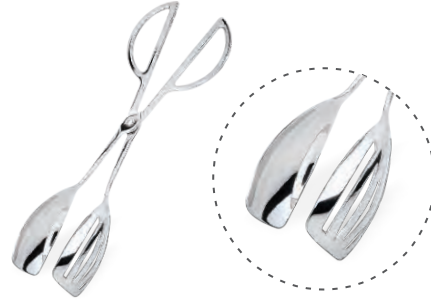
» Makaslı Maşa Serving Tong