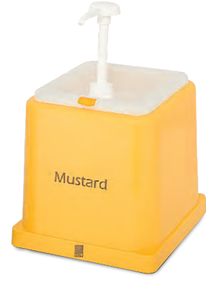
» Hardal Dispenseri Mustard Dispenser