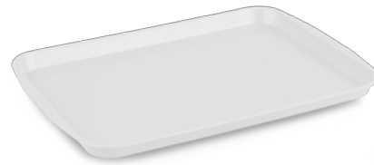
» Servis Tepsisi (ABS) Serving Tray (ABS)