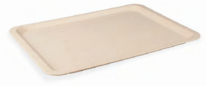
» Kırçillı Tepsi Textured Tray