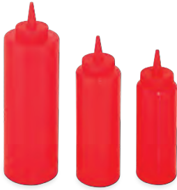
» Ketçap Şişesi Ketchup Bottle