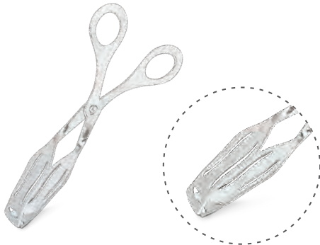
» Makaslı Maşa Küçük Bread/Pastry Tong Small