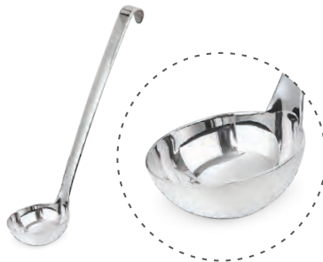
» Çorba Kepçesi Ladle