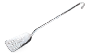
» Süzgeçli Servis Spatula Perforated Serving Spatula