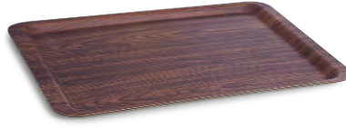
» Maun Dikdörtgen Tepsi Wooden Rectangular Tray