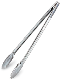
» Çok Amaçlı Maşa Multi-Purpose Tong