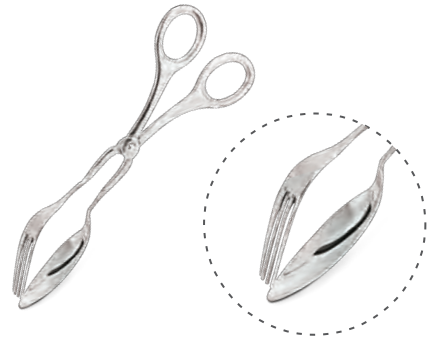
» Makaslı Maşa Küçük Salad Tong Small