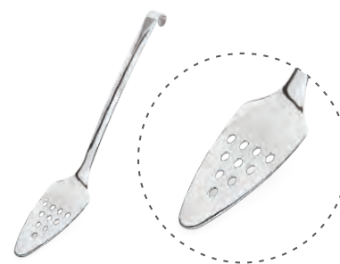
» Delikli Kek Servis Perforated Spatula