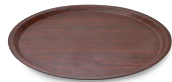
» Fiber Kaydırmaz Yuvarlak Tepsi Fiber Non-slip Round Tray