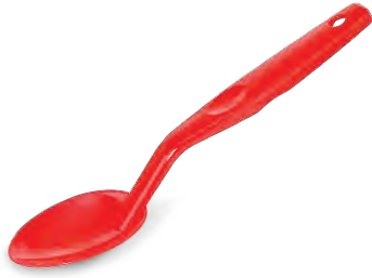
» PC Servis Kaşığı plast|port PC Serving Spoon