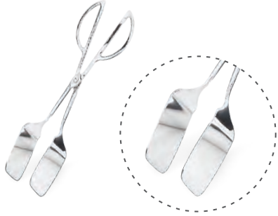
» Makaslı Maşa Bread/Pastry Tong