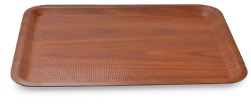
» Fiber Kaydırmaz Dikdörtgen Tepsi Fiber Non-slip Rectangular Tray