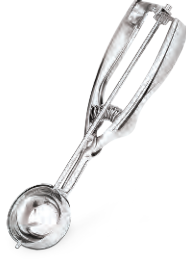
» Dondurma/Ordövr Makası Ice Cream Spoon

* Fiyata kepçe dahil değildir. * Ladle is not included