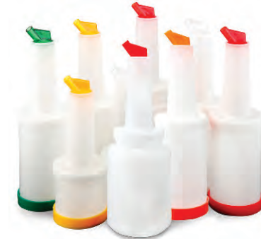
» Sos/Şurup Dökücü Pouring Container