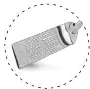
» Monoblok Süzgeçli Servis Spatula Monoblock Perforated Spatula