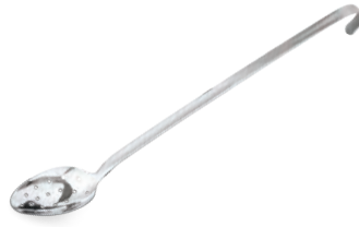
» Monoblok Süzgeçli Kaşık Monoblock Perforated Spoon