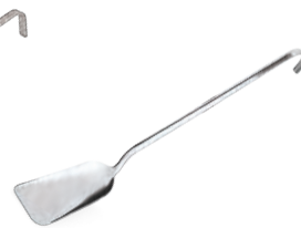
» Servis Spatula Serving Spatula