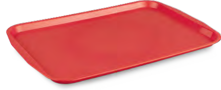
» Servis Tepsisi (ABS) Serving Tray (ABS)