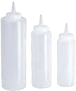
» Şeffaf Sos Şişesi Transparent Sauce Bottle