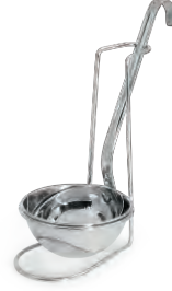
» Kepçe/Kaşık Standı Spoon/Ladle Rest