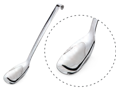
» Servis Kasığı Serving Spoon