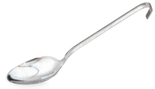
» Düz Servis Kaşık Serving Spoon