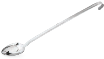
» Monoblok Düz Kaşık Monoblock Spoon