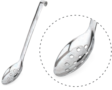
» Delikli Servis Kasık Perforated Spoon