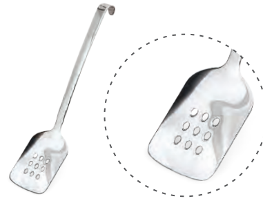
» Delikli Spatula Perforated Turner