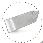
» Monoblok Servis Spatula Monoblock Spatula