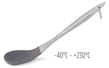
» Silikon Kaşık Silicone Spoon