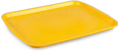
» Servis Tepsisi (ABS) Serving Tray (ABS)