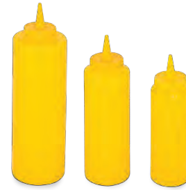
» Hardal Şişesi Mustard Bottle